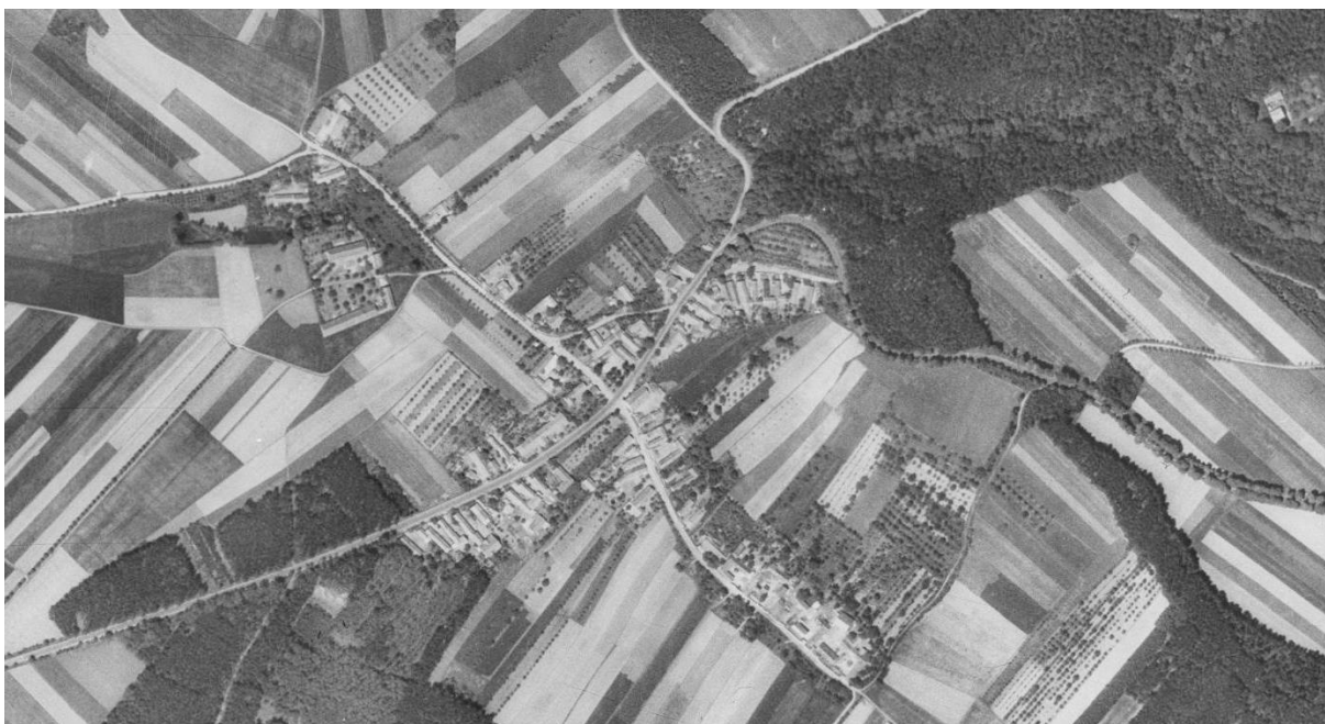
r. 1950