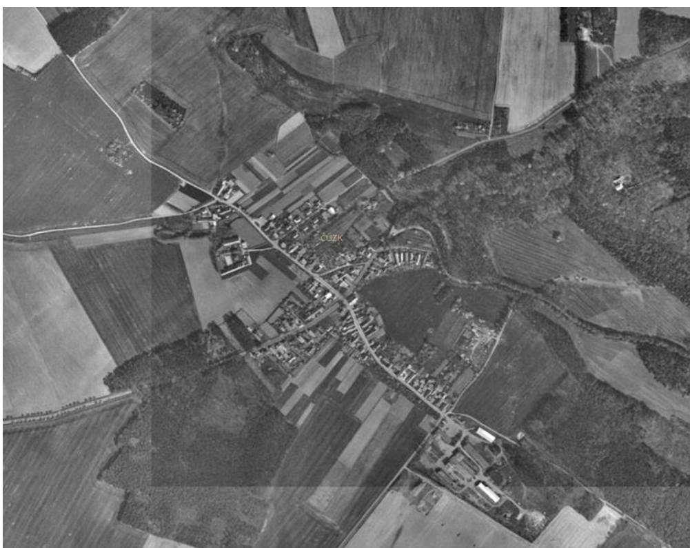
r. 2000